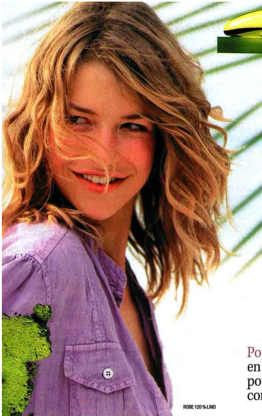
ROBE 120% LINO